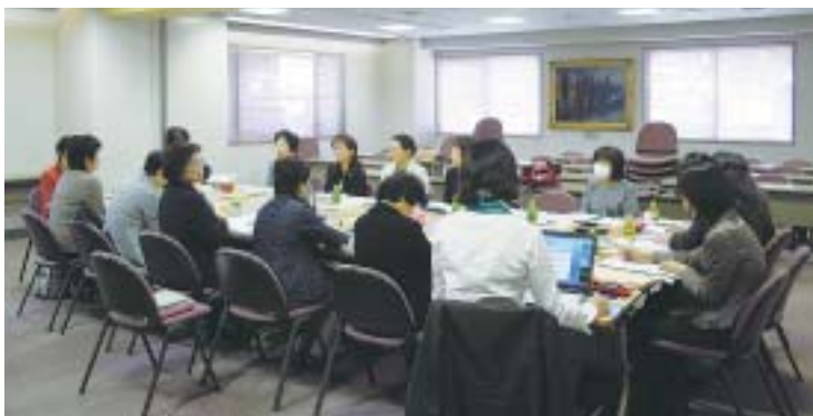
公益社団法人 高知県看護協会 第1回理事会

皆様方の一層のご支援とご協力をお願いいたしまして、公益法人スタートにおけるご挨拶とさせていただきます。