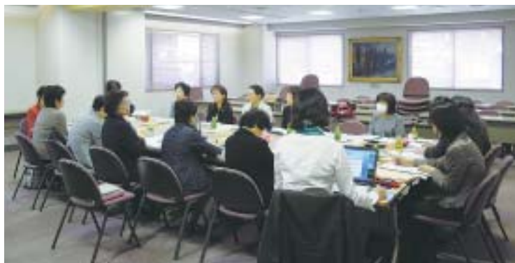
公益社団法人 高知県看護協会 第1回理事会

皆様方の一層のご支援とご協力をお願いいたしまして、公益法人スタートにおけるご挨拶とさせていただきます。