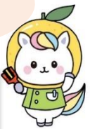
高知県かんごちゃん