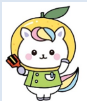
マスコットキャラクター かんごちゃん