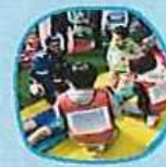
災害時医療支援活動訓練 大豊地区災害時医療支援活動訓練